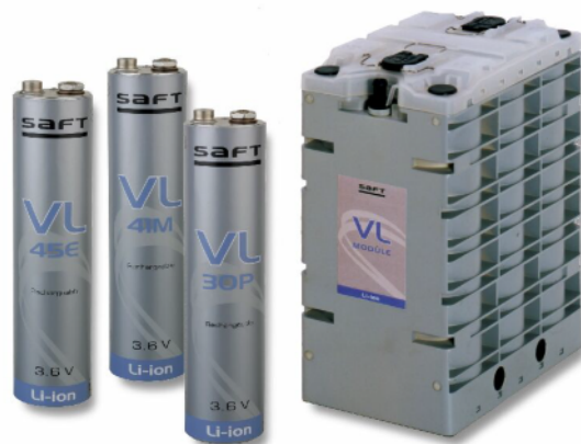
Abb.2: Saft Lithium-Ionen Batterie

Bei netzgekoppelten Anwendungen verfügt die neueste verfügbare Batterietechnologie – die Lithium-Ionen-Batterie (Li-Ionen-Batterie) – über das Potenzial für wesentliche Verbesserungen bei Leistung und Lebensdauer und ist außerdem vollständig wartungsfrei.